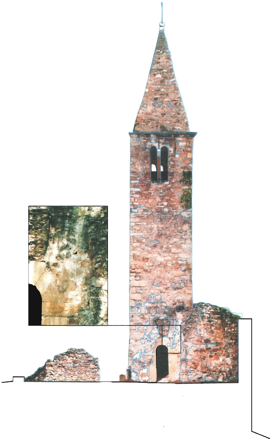
Fig. 1. Prospetto Sud. Restituzione grafica e individuazione delle aree per l'analisi morfologica e costruttiva (prima dell'intervento di restauro).